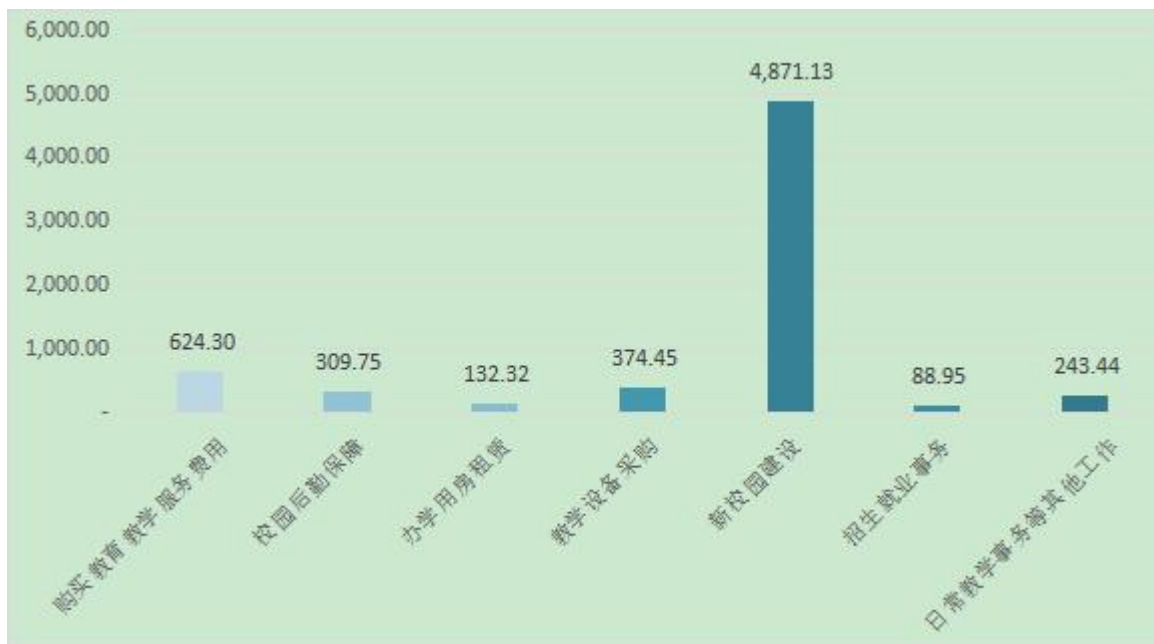
图 1 2022 年度项目预算安排情况